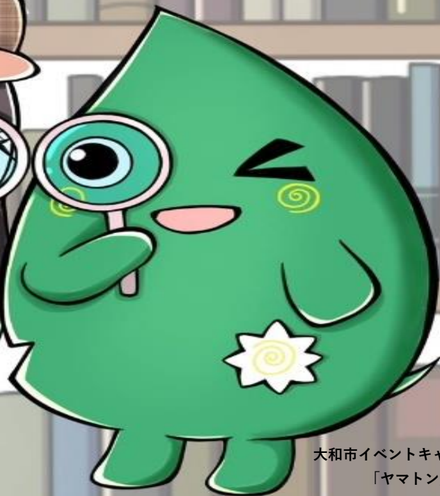
大和市イベントキャラクター「ヤマトン」

『小田急線で行こう！ 図書館を巡ってなぞとき探検 in大和市 2024』の楽しみ方