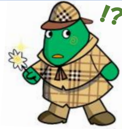
大和市イベントキャラクター「ヤマトン」